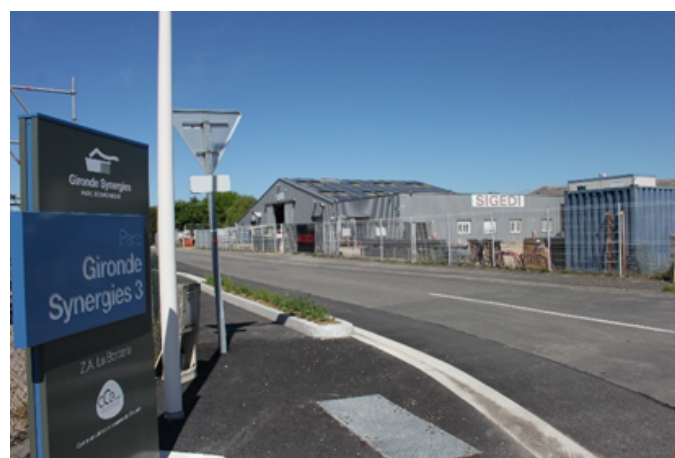
Zone d'activités de la Borderie : entrée depuis la RD 255