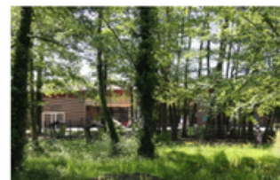
Vue sur l'arrière de l'ALSH où des espaces de jeux et de détente ont été aménagés à l'ombre des arbres