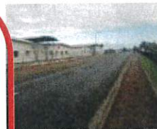
C'est ce secteur de La Borderie, direction de Saint-Ciers, qui va être rattaché à Braud-et-Saint-Louis.