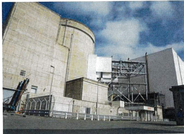
Le Scot de la Haute Gironde Blaye-Estuaire est en prospective par rapport à l'avenir de la centrale.

Or, dans ce secteur se trouve une zone d'activité économique qui fonctionne plutôt bien, « et où des entreprises travaillent justement avec le nucléaire ». D'où cette vo-