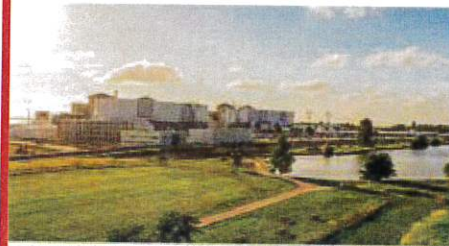
l'avenir de la centrale nucléaire du Blayais fait l'objet de réflexions au sein du SCoT de la Haute-Gironde Estuaire.

Autre point qui occupe particulièrement les élus du syndicat mixte